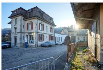
Die Kasag, Strada 40 in Langnau stellt unter anderem Anlagen für die Zisternenbau her.